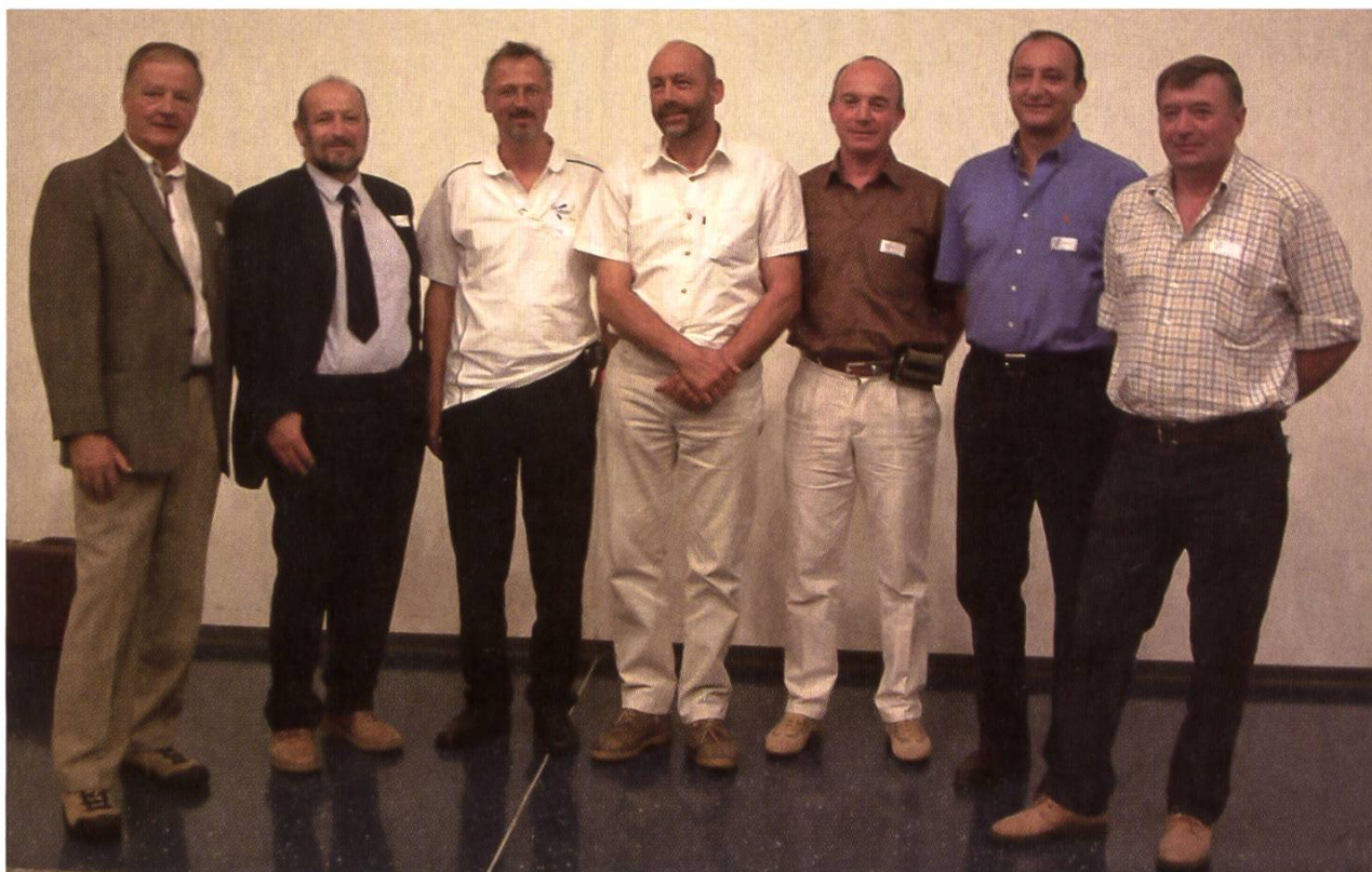
De gauche à droite: président FSSA, de la SAR, du comité d'organisation, 2 représentants de Haute-Savoie et de la Vallée d'Aoste.

l'esprit des organisateurs. Egale à ce qui se fait chez nos collègues de langue allemande, en Suisse alémanique, Autriche et Allemagne.