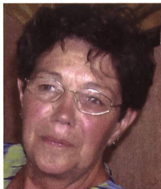
Société d'apiculture du Jorat