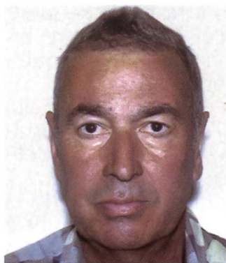
Société d'apiculture de La Chaux-de- Fonds et environs