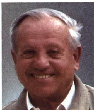
Société d'apiculture de Sion