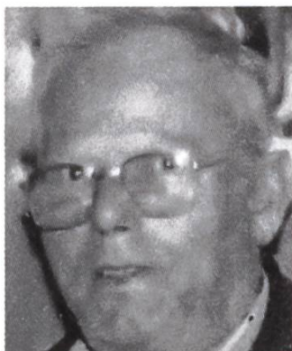
Société d'apiculture de l'Orbe