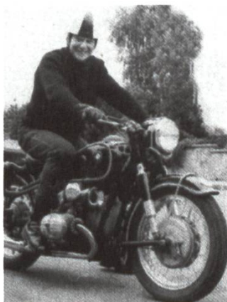
Société d'apiculture du Pays-d'Enhaut