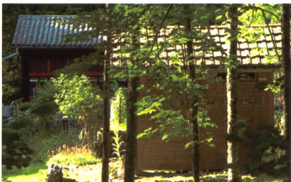
Le «Bardot» dans son écrin de verdure.

Merci à Francis Sandmeier pour l'organisation de cette visite, à la famille