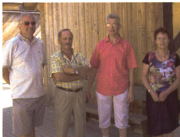
Les apiculteurs qui nous ont reçus à la Maison de la nature.