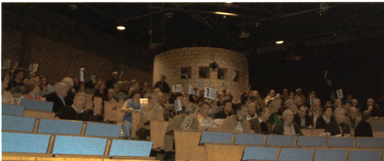
Vote des délégués.

sont présentés et acceptés à l'unanimité.