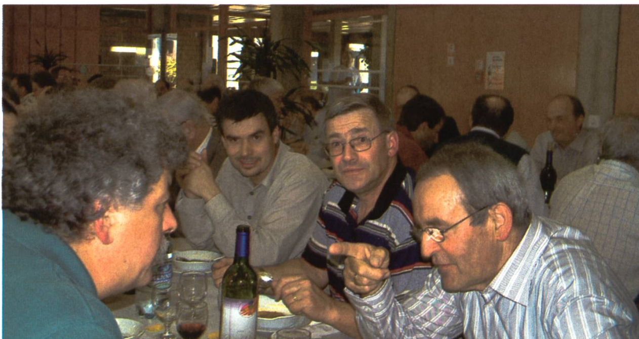
Un président cantonal et imprimeur attentif...

L'assemblée des délégués 2006 aura lieu dans le Jura, à Porrentruy