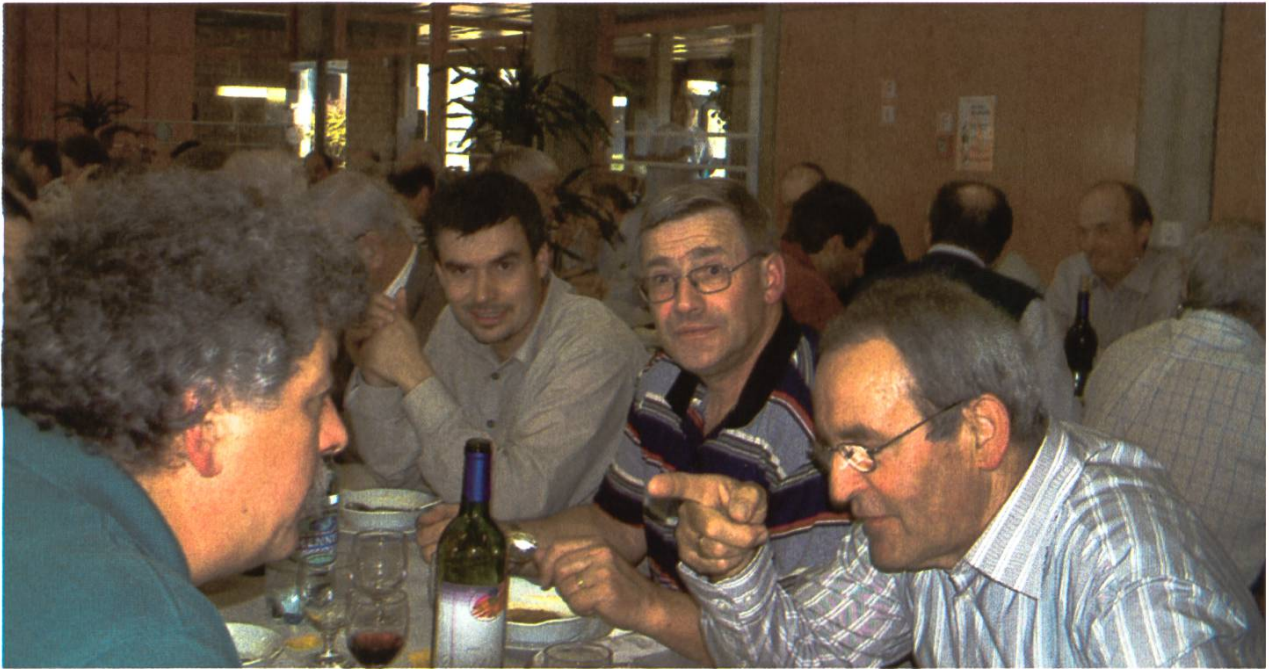
Un président cantonal et imprimeur attentif...

L'assemblée des délégués 2006 aura lieu dans le Jura, à Porrentruy