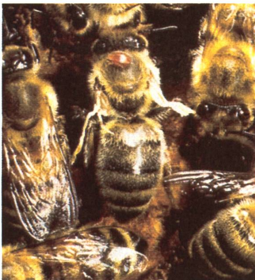
L'acarien est peu visible sur le corps de l'abeille, car il se cache dans les segments des pattes arrières.