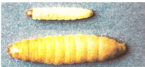
Grande et petite teigne. Couleur et grandeur variables.