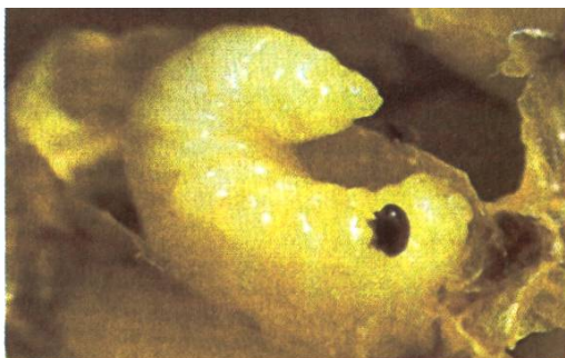
L'acarien varroa sur une larve à mâle. Le cycle de la reproduction se fait dans le couvain operculé.