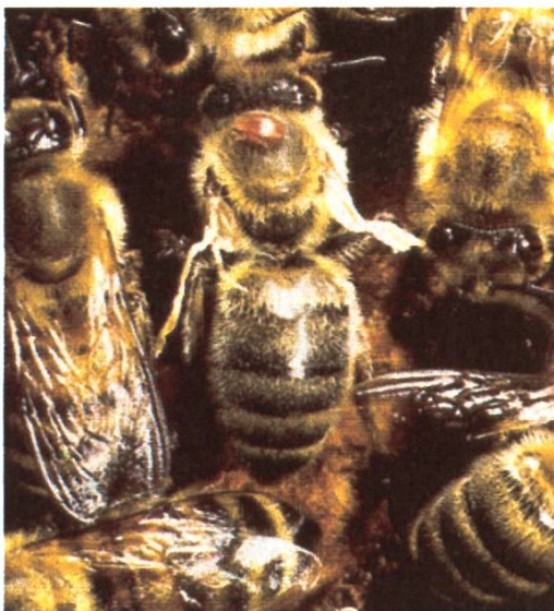
L'acarien est peu visible sur le corps de l'abeille, car il se cache dans les segments des pattes arrières.