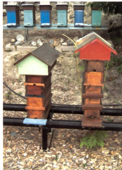
Voilà l'élevage en gratte-ciel!