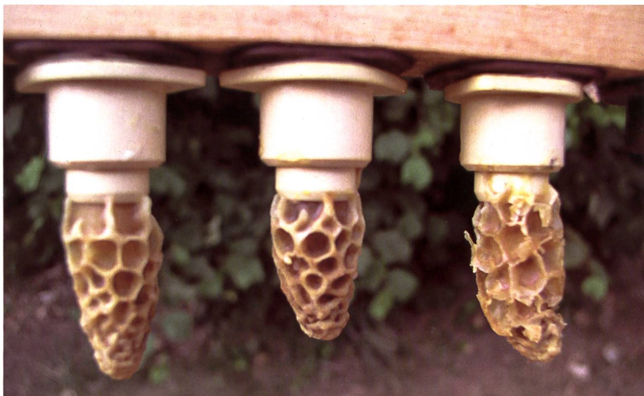
Cellules royales.

Et puis, surveillez régulièrement Varroa destructor . Mettez souvent un lange sur le fonds du tiroir pour contrôler la chute naturelle. A fin juillet, il devrait tomber moins de dix varroas par jour. Pour faciliter le comptage, je vous conseille de quadriller votre lange au moyen d'un feutre indélébile; vous