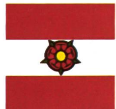
Loveresse, le village natal de Grock !

Et pourtant, ce petit village, qui compte cinq agriculteurs, un peu d'industrie (décolletage, informatique, réparation d'appareils ménagers), et qui abrite aussi l'école d'agriculture, en pleine mutation, ainsi qu'un hôtel-restaurant, un restaurant et une bergerie ouverte chaque fin de semaine, mérite votre attention.