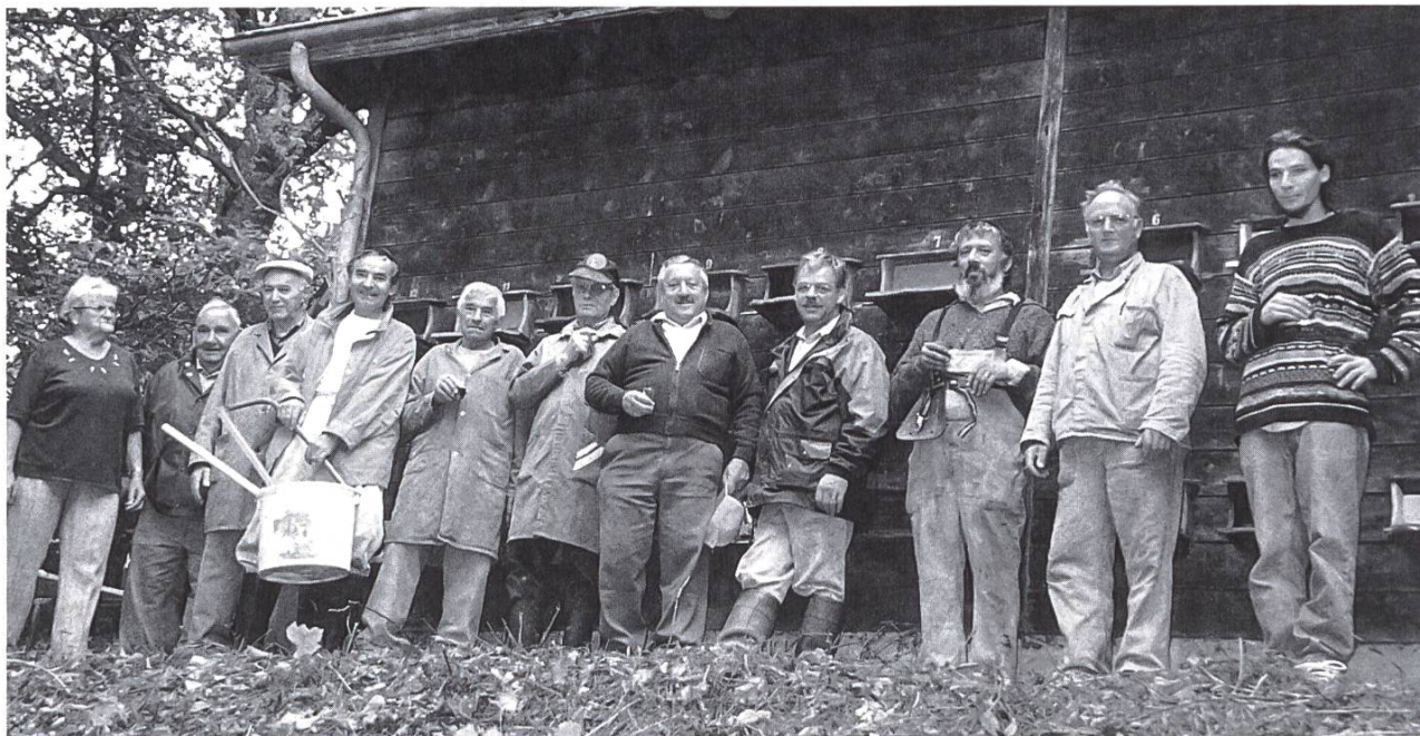
Equipe « salopette » au travail.