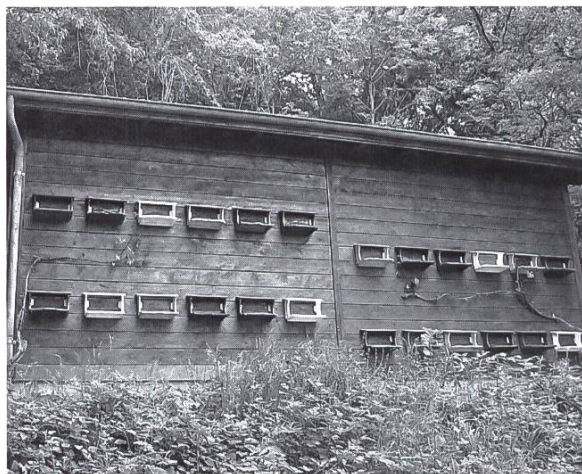
Rucher de formation de la Coudre.