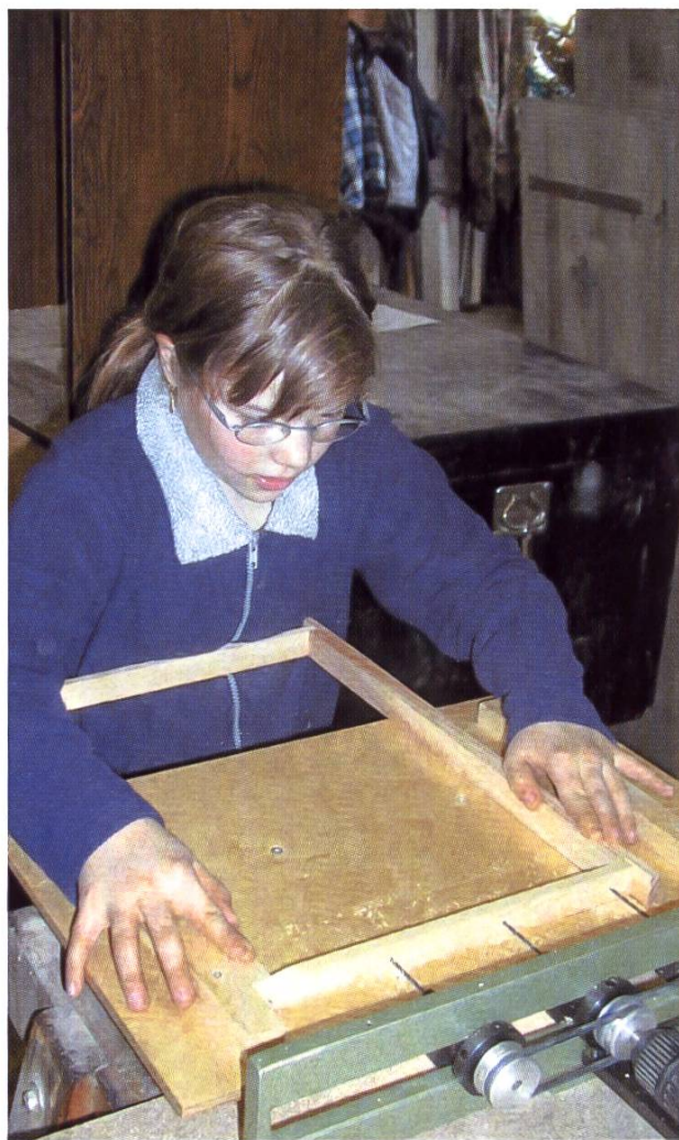
Perçage des trous de fils – Il n'y a pas d'âge !

Pratiquez-vous le nourrissage printanier spéculatif ? Si oui, comment ?