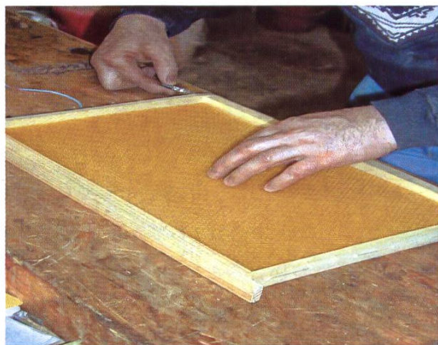
Pose de la cire.