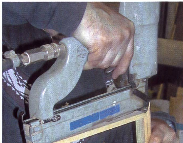
Montage des cadres.