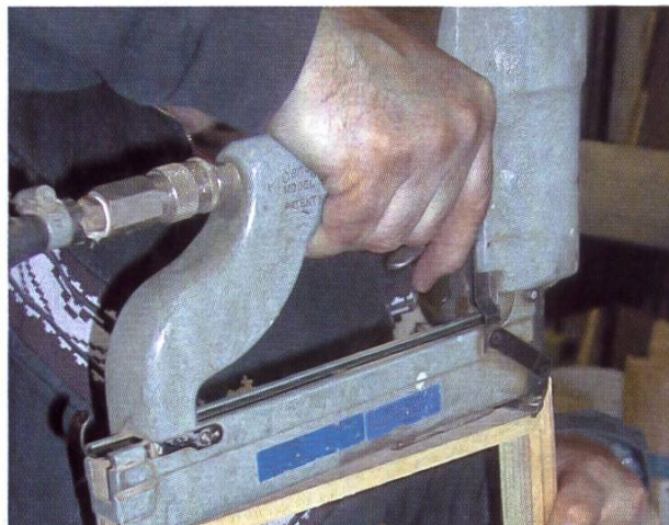
Montage des cadres.