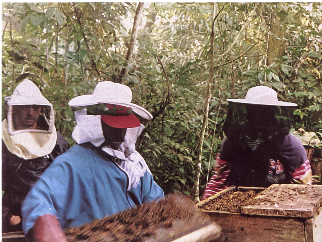
Apiculteurs camerounais munis des voiles du « Rucher du cheminot de Serdinya » et du « Jardin du cheminot de Paris ».