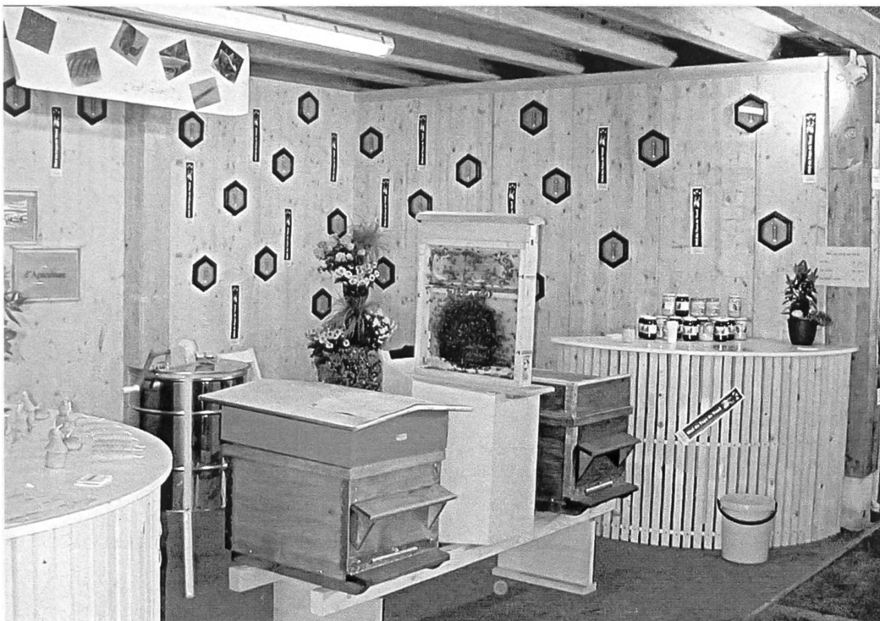
Stand FVA, Comptoir suisse.

En conclusion, ce Comptoir 2000 a été une réussite. Le comité de la Fédération remercie chaleureusement toutes les personnes qui ont œuvré bénévolement pour faire connaître notre hobby et défendre la cause apicole auprès du grand public.