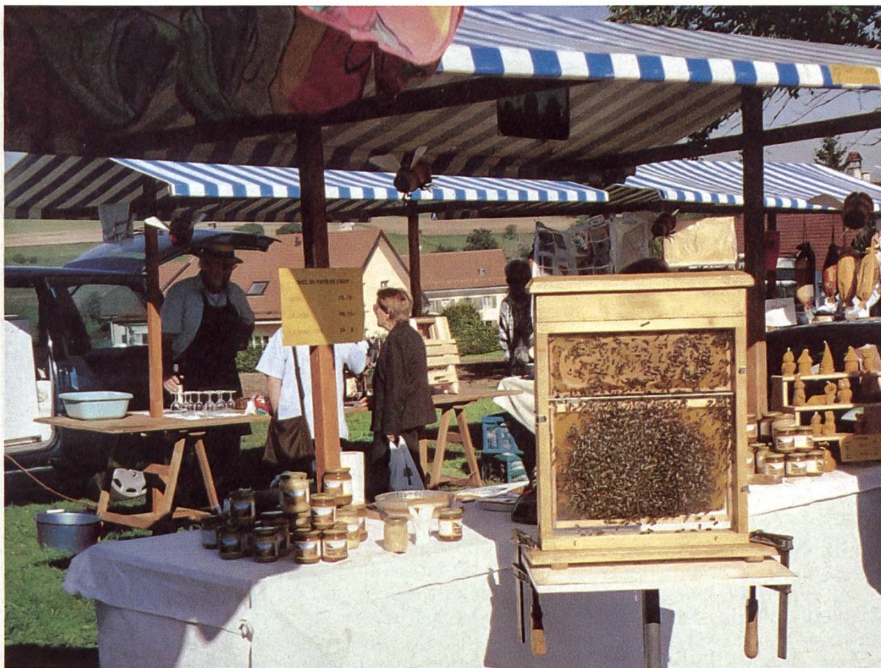
Banc de notre marché à Carrouge.