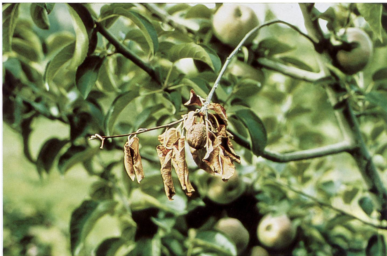
Branche atteinte par le feu bactérien.

Le feu bactérien est une maladie bactérienne particulièrement dangereuse qui s'attaque aux arbres fruitiers à pépins ainsi qu'à quelques espèces ornementales et forestières. Un arbre attaqué peut mourir en l'espace d'une période de végétation. Dans les régions arboricoles du sud-ouest de l'Allemagne, le feu