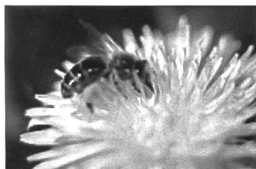
Abeille récoltant du pollen.