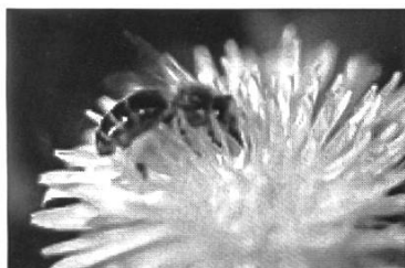
Abeille récoltant du pollen.