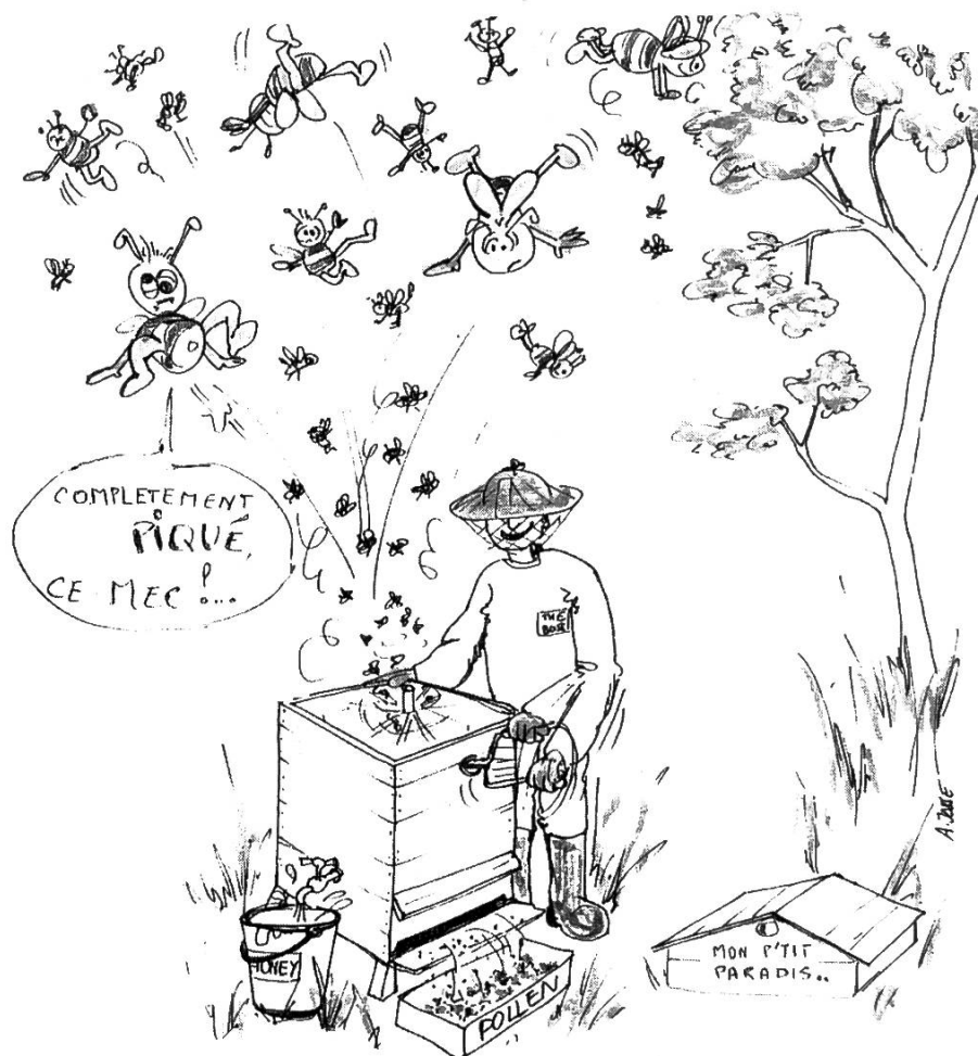
Dessin de Lionel JOSSE

Quel beau jour aujourd'hui, un temps pour rendre visite aux ruches. Je m'approche sans faire de bruit, pas facile il faut éviter les bûches, les branches et cette fois même un essaim. C'est toujours un émerveillement de voir cette grappe pendue si facilement à un sapin.