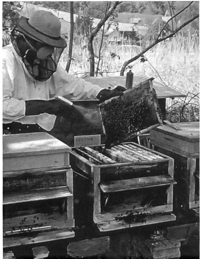
Pulvérisation de la solution d'acide oxalique : 3 - 4 ml par face de cadre occupée.

Cette méthode utilise une solution faite d'une part d'acide oxalique dihydraté et de 10 parts d'eau, de même que de 10 parts de sucre. On déverse sur les abeilles 5 ml de cette solution par ruelle de cadre occupée au moyen du doseur de Perizin ou d'une seringue. Pour une colonie faible, il faut environ 30 ml, pour une colonie moyenne 40 et pour une colonie forte 50 ml de solution. Les traitements doivent être effectués à une température supérieure à 5°C et la solution « chambrée » avant son utilisation. Le travail requis par cette