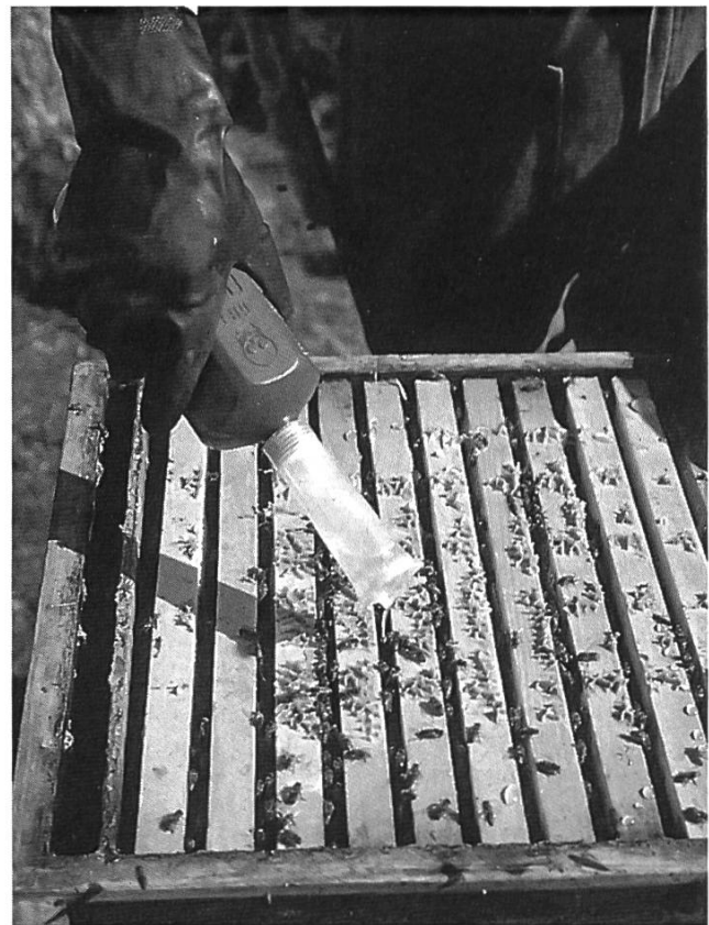
Dégouttement de la solution sucrée d'acide oxalique : 5 ml par ruelle occupée.