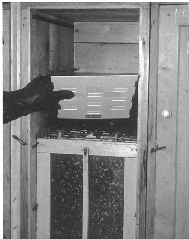
Diffuseur Apidea - Dans les ruches suisses, ce diffuseur devrait se placer dans le sens de la largeur de la ruche et pas dans celui de la longueur comme sur la photo.

Diffuseur à réservoir avec mèche d'évaporation en carton buvard. Le dispositif se fixe dans un cadre et celui-ci est placé dans la ruche à un cadre de distance du dernier cadre de couvain. Nous avons suivi les recommandations d'uti-