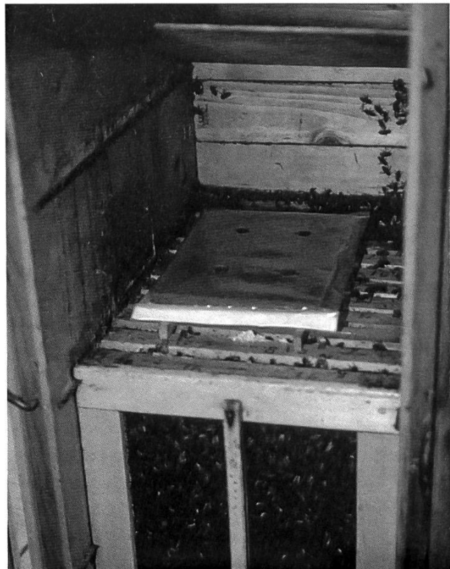
Plaque de Krämer.

une épaisse feuille en polyéthylène. La plaque est prête à l'emploi. Avant le traitement, il faut perforer un certain nombre de trous dans l'enveloppe plastique et placer la plaque sur le dessus des cadres en intercalant deux lattes de 2 cm d'épaisseur. Prévoir également un espace de 2 cm sur le dessus des plaques. Une plaque, qui n'est utilisable qu'une année, sert aux deux traitements automnaux. Nous avons suivi les recommandations d'utilisation fournies par Biocontrol AG, Grossdietwil.