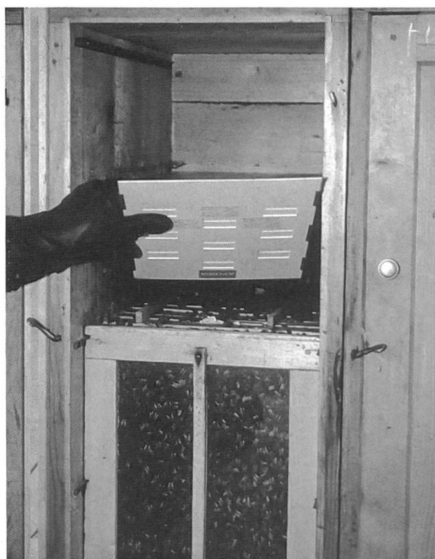
Diffuseur Apidea - Dans les ruches suisses, ce diffuseur devrait se placer dans le sens de la largeur de la ruche et pas dans celui de la longueur comme sur la photo.

Diffuseur à réservoir avec mèche d'évaporation en carton buvard. Le dispositif se fixe dans un cadre et celui-ci est placé dans la ruche à un cadre de distance du dernier cadre de couvain. Nous avons suivi les recommandations d'uti-