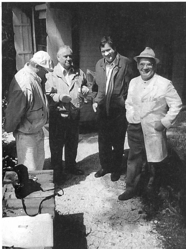
Accueil à la station « Steinegg ».

Les délégués SAR remercient sincèrement les représentants de la VDRB, les félicitent pour leur savoir-faire et désirent œuvrer avec eux pour l'apiculture de notre pays.