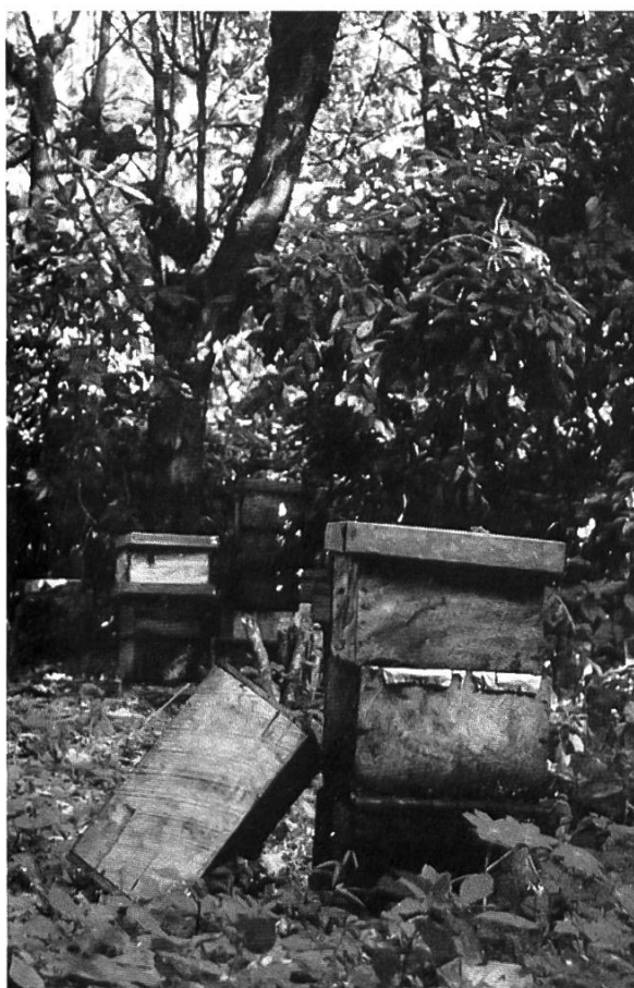
Des ruches agressives.

D'autre part, je commence à m'intéresser à l'élevage des abeilles indigènes