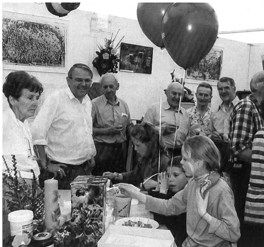
Au stand apicole de la section des Alpes, quel succès !