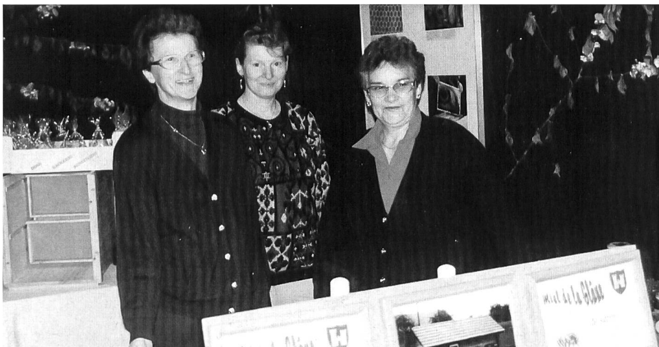
Gros plan sur les « Reines » de la fête.