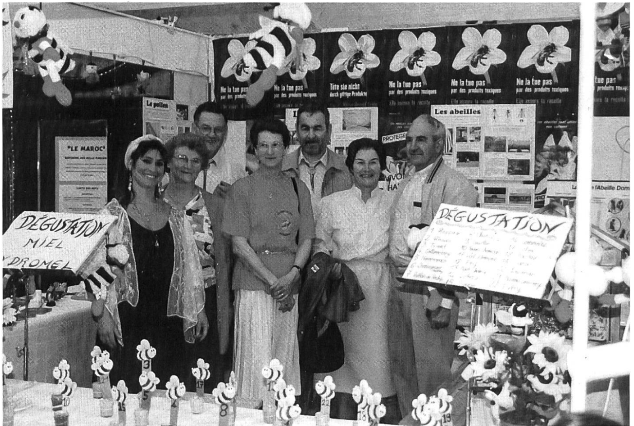
Les Fribourgeois sont là...