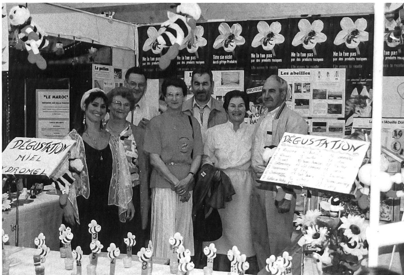
Les Fribourgeois sont là...