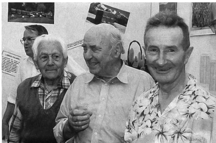
L'accueil des « Sages ».

Au stand apicole de la section des Alpes, quel succès !