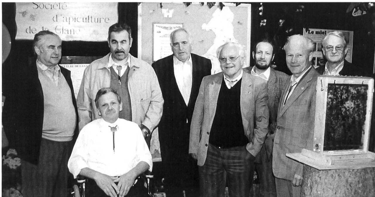
La Glâne reçoit la SAR...

Ils étaient tous là : le président accueillant tout le monde (comme sur des roulettes) ; les épouses d'apiculteurs, préparant les tartines de dégustation au miel ; les apiculteurs, verre de l'amitié à la main, expliquant leurs abeilles, leurs ruches, leur passion. C'était beau, on y était bien ; dommage, il fallait partir... Nous reviendrons.