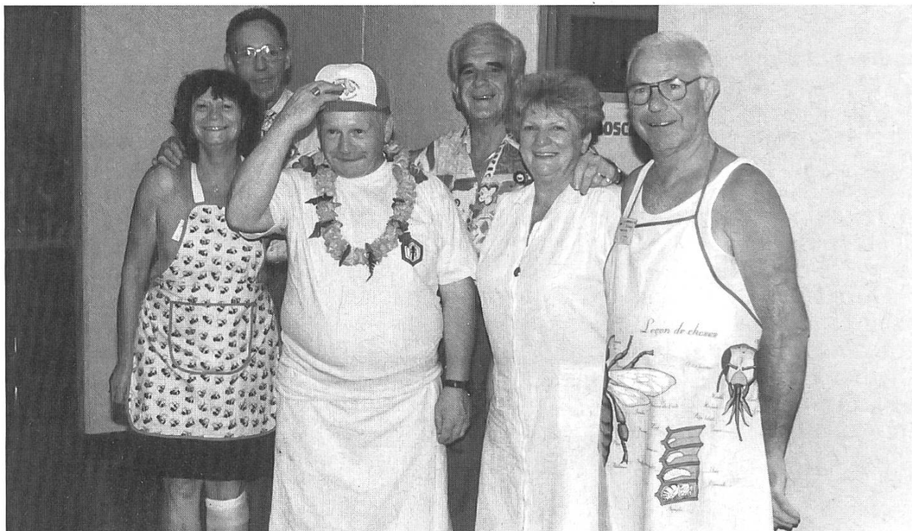
La joie de servir des « travailleurs de l'ombre ».