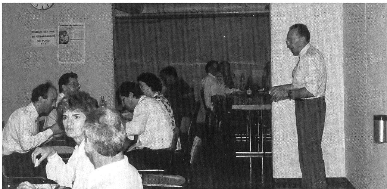
Le chef « en action ».