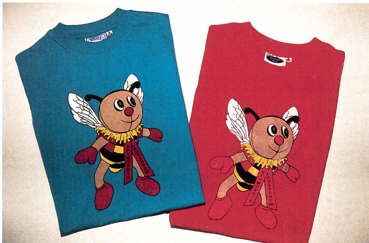
T-shirt, modèle «whale», avec logo du congrès imprimé.