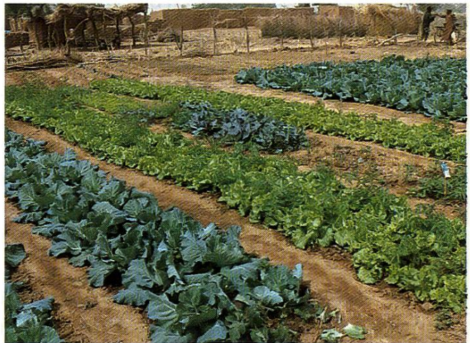
Culture maraîchère, sous la surveillance d'un spécialiste suisse, qui est également apiculteur.