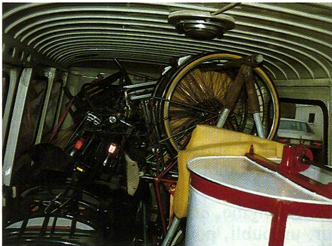
Le bus prêt pour le grand voyage, chargé de matériel apicole, de vélos, de matériel scolaire.