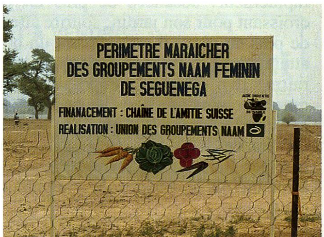
Une autre réalisation de la Chaîne de l'amitié avec, bien entendu, le puits pour l'eau.