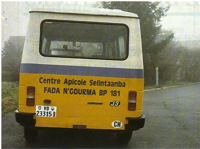
Le bus offert par une administration d'Yverdon.