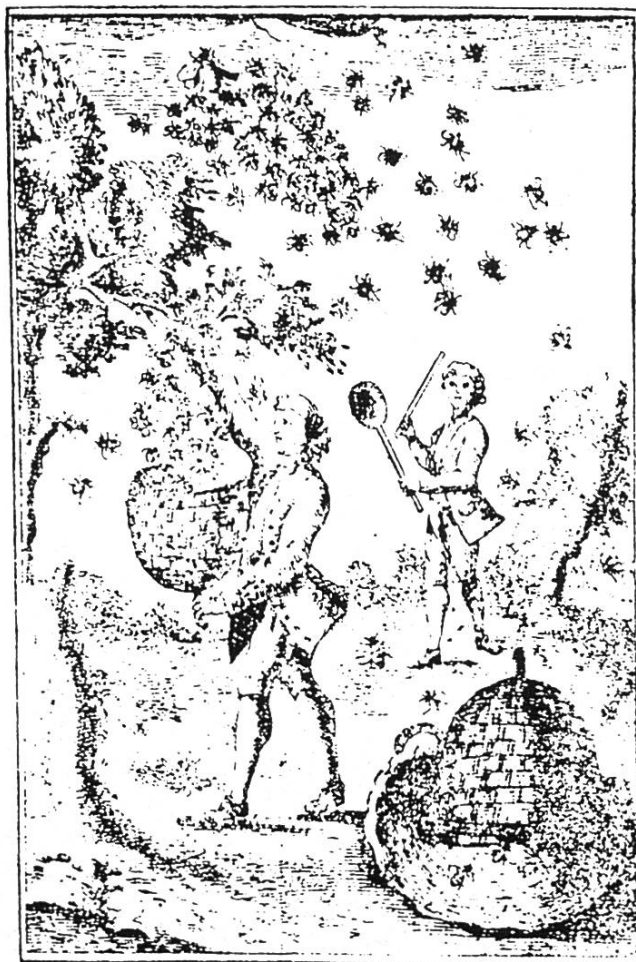
Manière d'amasser et de recevoir les essaims (extrait de L'Apiculteur par l'Image ).

L'essaim envolé, il était de règle de procéder à une coutume ancienne, celle du «charivari». Elle était déjà prescrite dans l'Antiquité. Ce bruit, pour les Anciens, était le rappel du vacarme que les Corybantes faisaient lors de la célébration des mystères de Cybèle. Pour d'autres, c'était une imitation du tonnerre qui avait pour effet de faire rentrer les abeilles à la ruche. Il est cependant vraisemblable que ce charivari, fait de ferrailles entrechoquées et de cris, avait pour but d'affirmer la propriété de l'essaim et de permettre au poursuivant l'exercice du droit de suite,