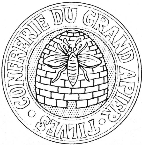
Médaille de « Grand moh'lî d'honneur ».

Enfin, récemment, la confrérie a formé le dessein de réunir tous les apiculteurs d'où qu'ils viennent. C'est le Musée de l'abeille qui devrait devenir le point de ralliement à partir duquel toutes les forces vives entreprendraient les actions qui s'imposent pour la sauvegarde et le développement de l'apiculture.