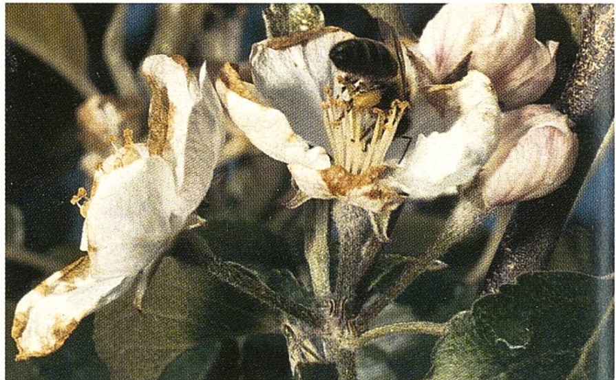
Fig. 6: Butineuse sur les dernières fleurs. Lors des essais 1987-1988, nous avons reconnu pour la première fois l'importance des arbres fruitiers en fleurs comme sources de pollen.