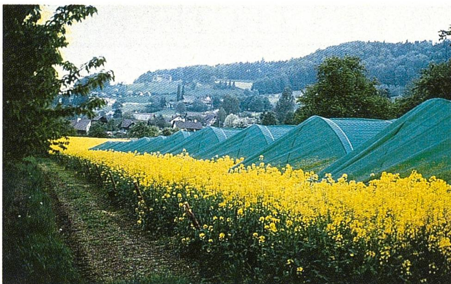
Fig. 4: Essais comparatifs à 3 dosages sous 11 tunnels sur une superficie de 30 \times 5 \times 2,8 m de colza en fleur.