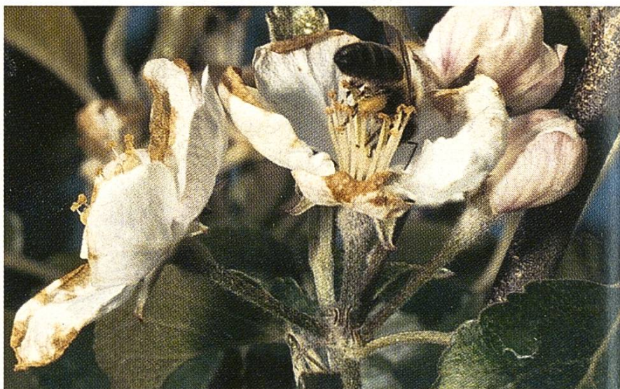
Fig. 6: Butineuse sur les dernières fleurs. Lors des essais 1987-1988, nous avons reconnu pour la première fois l'importance des arbres fruitiers en fleurs comme sources de pollen.