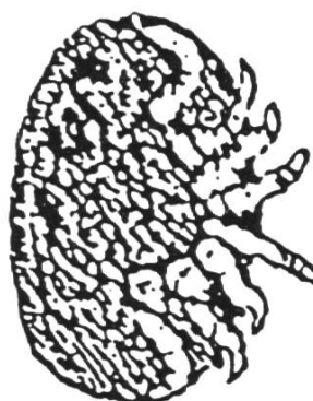
Femelle de varroa vue ventrale (4 paires de pattes)

Celle-ci prélève une taxe d'examen de 15 francs.