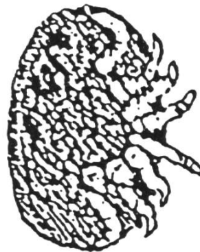
Femelle de varroa vue ventrale (4 paires de pattes)

Celle-ci prélève une taxe d'examen de 15 francs.