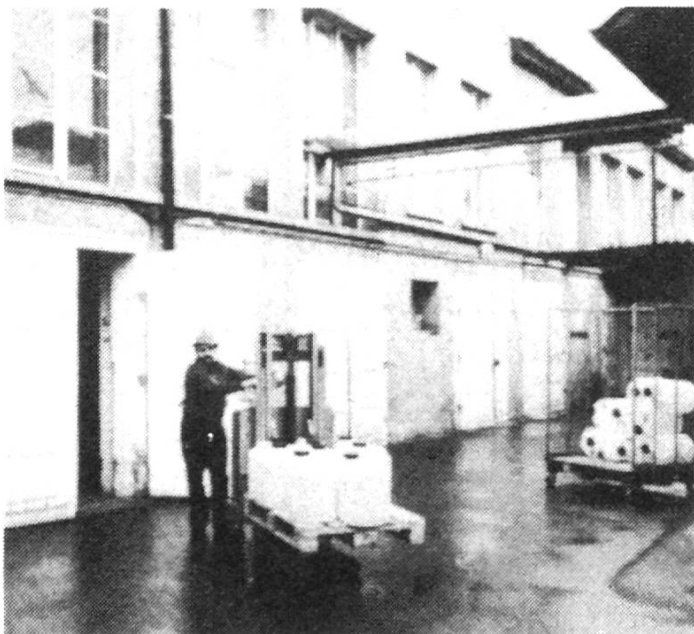
Notre entreprise à Zurich-Altstetten, Hohlstr. 501, sortie de l'autoroute Zurich-Altstetten.

De plus en plus d'apiculteurs achètent le sirop de sucre « Hostettler » pour abeilles, tout préparé, car... ce qui est pratique ne doit pas être cher!