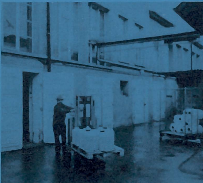
Notre entreprise à Zurich-Altstetten, Hohlstr. 501, sortie de l'autoroute Zurich-Altstetten.

De plus en plus d'apiculteurs achètent le sirop de sucre « Hostettler » pour abeilles, tout préparé, car... ce qui est pratique ne doit pas être cher !