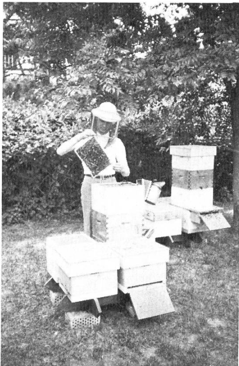
Un rucher moderne