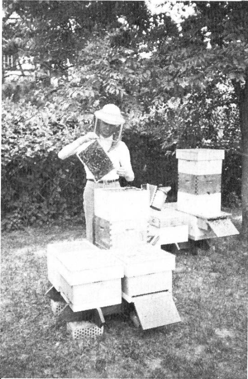
Un rucher moderne