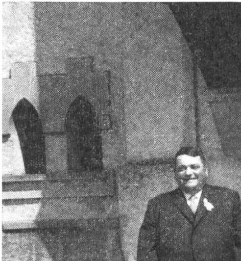
† AUGUSTIN GUERRY