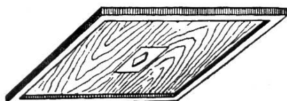
Planche chasse-abeilles DB et DT

Appareil indispensable pour prélever le miel rapidement, sans piqûres ni danger de pillage. — Ne devrait manquer dans aucune exploitation apicole. — Fonctionnement simple et rapide. Mode d'emploi joint.