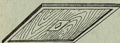
Planche chasse-abeilles DB et DT

Appareil indispensable pour prélever le miel rapidement, sans piqûres ni danger de pillage. — Ne devrait manquer dans aucune exploitation apicole. — Fonctionnement simple et rapide. Mode d'emploi joint.