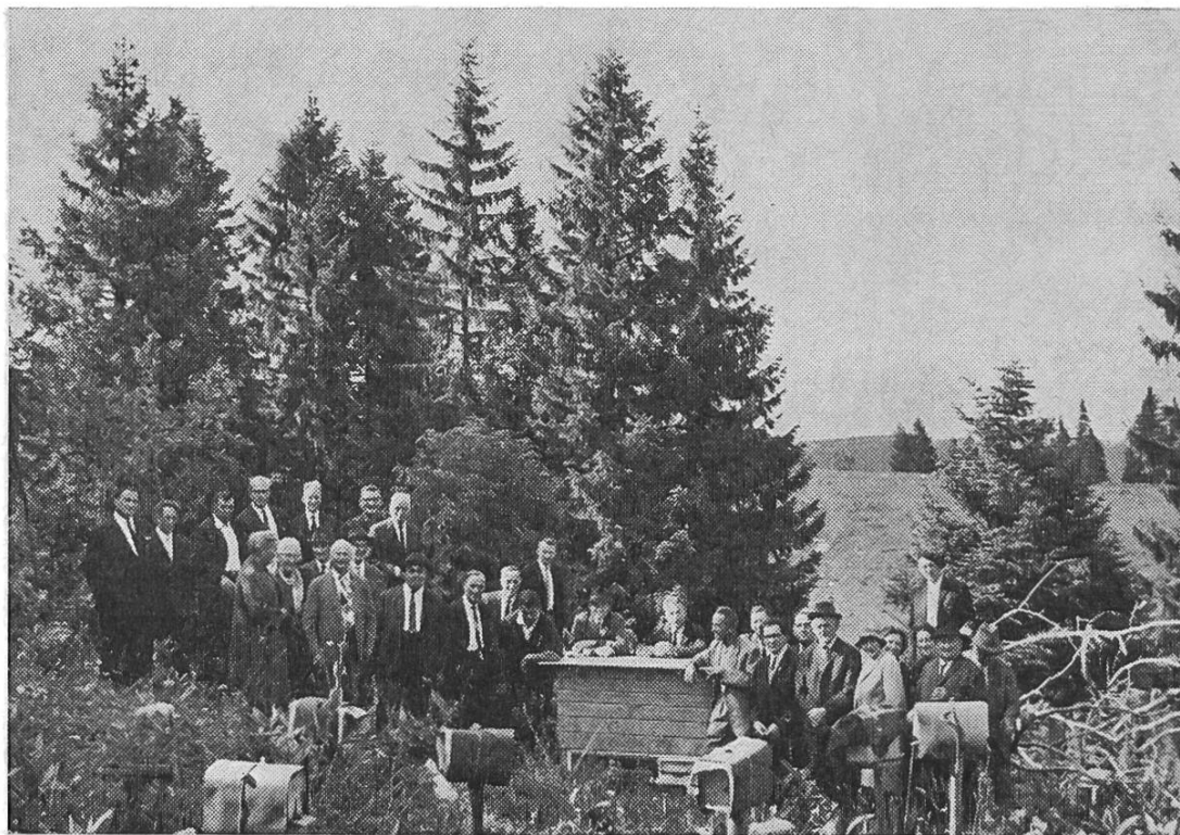
Station de fécondation du Chasseral

Les trois colonies productrices de faux bourdons sont fournies par la section du Liebefeld. Pour couvrir les grands frais il est perçu une petite finance de