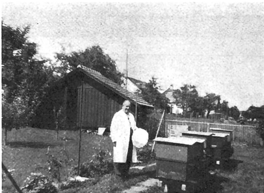
Rucher de Echenard René à Pully

7 ruches D.B. plus 1 nucleus à « Vers-chez-les-Blancs », alt. 850 m.