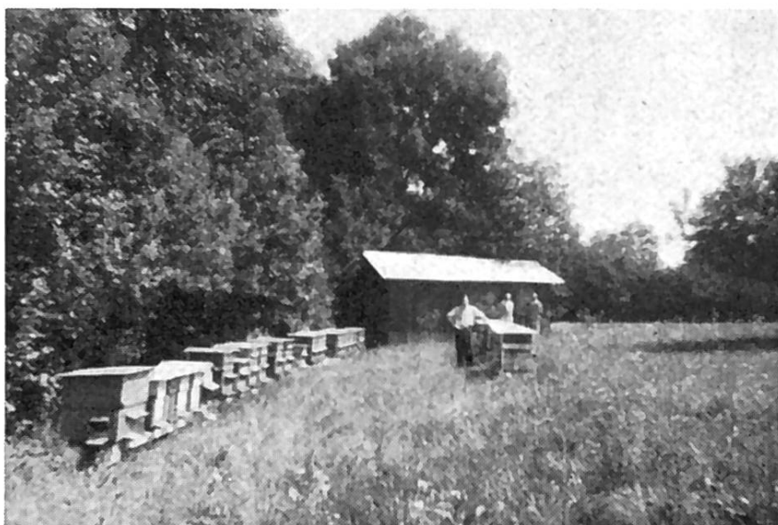
Rucher de Jaquier Gaston à Goumoëns-la-Ville

Provisions bonnes, sauf chez une reine caucasienne 1958, très prolifique, peu prévoyante et qui ne donne pas satisfaction. Matériel : matériel d'élevage et outillage au complet. Un ravissant pavillon, construit et aménagé avec goût par le propriétaire, sert de laboratoire et de local de magasinage. Les annotations par colonies sont bonnes, mais la comptabilité d'une aussi grande exploitation doit être plus complète et donner une idée exacte de la rentabilité. Cet apiculteur très méritant, dont l'état de santé laisse à désirer, travaille avec calme, aime ses abeilles, les comprend et possède une excellente formation, tant pratique que théorique.