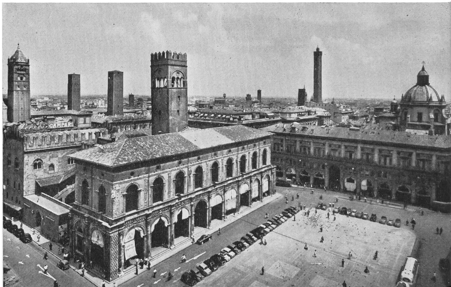
Bologne - La place Majeure avec le palais du podestat

En d'autres termes, même si la participation au Congrès préliminaire, pour un ensemble de raisons évidentes, ne se fera que sur invitation et sera donc nécessairement limitée à un nombre restreint de personnes qualifiées par leur