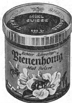
Boîte PLEXI avec étiquette « Miel suisse » 4 couleurs