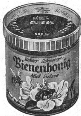
Boîte PLEXI avec étiquette « Miel suisse » 4 couleurs

Pour une quantité supérieure, prix spécial. Sans impression : 3 cts en moins.