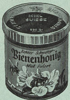
Boîte PLEXI avec étiquette « Miel suisse » 4 couleurs

Commandez les nouvelles boîtes PLEXI avec l'étiquette en 4 couleurs « Miel suisse » qui ne coûtent que 3 cts de plus.