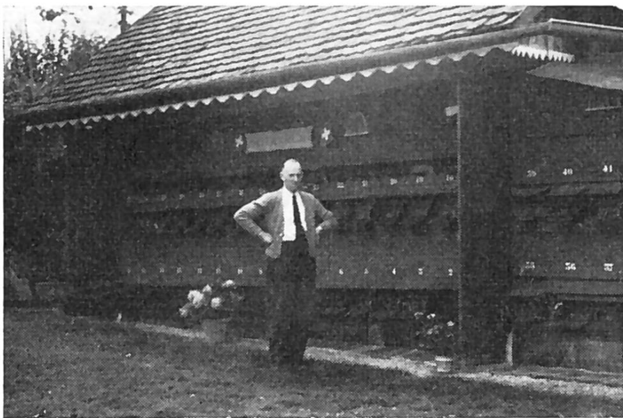
Page Albert à Pensier. Apier de toute beauté qui fait honneur à son propriétaire.

Beau rucher-pavillon bien entretenu, bonne orientation, situé dans le verger, en contre-bas de la ligne de chemin de fer Fribourg-Morat. L'intérieur est vaste et chaque chose est à sa place. Un laboratoire pratique est attenant au pavillon. A noter l'eau sous pression au rucher.