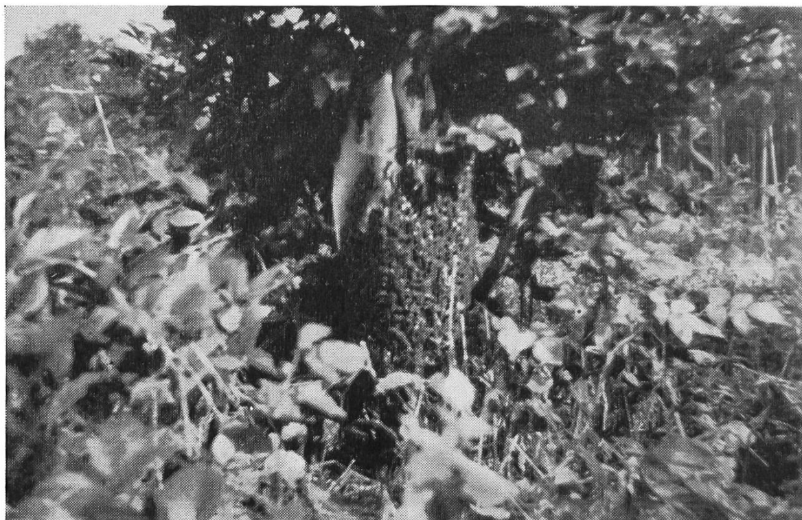
Construction d'un essaim au bas du tronc d'un hêtre.

L'essaim qui quitte sa ruche se pose en général à proximité du rucher, mais, souvent aussi, il est capable de s'en éloigner de telle façon qu'il est difficile de déterminer sa provenance. Dès lors, c'est l'essaim perdu, volage. Il s'installera dans un endroit quelconque. Il construira quelques ébauches de rayons. Si la saison est généreuse les rayons seront construits très rapidement. A-t-il trouvé l'abri convenable, un arbre creux par exemple, il y prospérera. Si au contraire il n'est que suspendu à une branche d'arbre, ses jours seront comptés. Les nuits froides de l'automne le décimeront peu à peu, puis il périra.