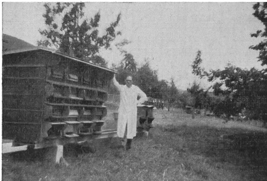
Ruches placées de façon judicieuse dans verger attenant à la maison