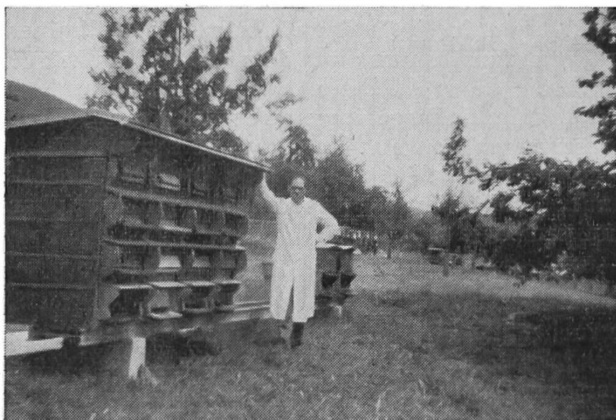
Ruches placées de façon judicieuse dans verger attenant à la maison

Cet apiculteur connaît bien son métier. Il possède 20 colonies logées en rucher-pavillon qu'il a construit lui-même. L'ordre et la propreté règnent dans ce rucher bien aménagé ; il est situé dans un verger en dehors du village. Colonies en général assez fortes ; quelques cadres gagneraient à être supprimés. Les