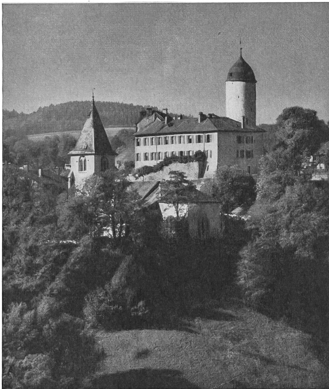
Le Château d'Aubonne

La section de « La Côte Vaudoise » a fait tout son possible pour vous préparer une journée agréable.