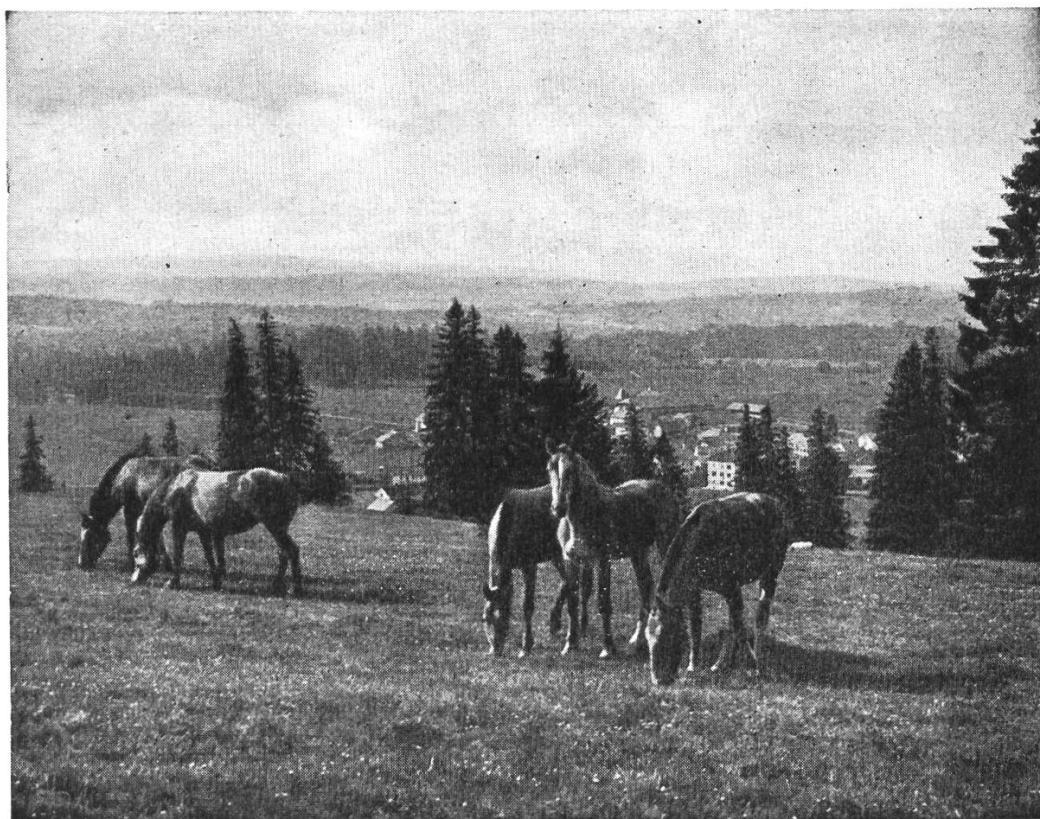
Pâturage dans les Franches-Montagnes