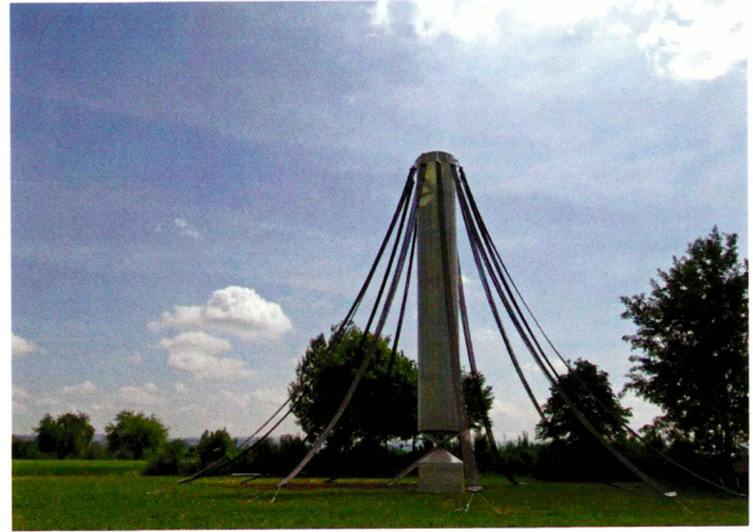
Christian Kurz (4)

auprès de la Chancellerie fédérale. Le rapide soutien de la population pour le maintien de paysages, d'espaces de vie et de délassément transmet un signal fort au monde politique: le sol suisse est une ressource limitée et non-renouvelable qui doit enfin être protégée d'une urbanisation actuellement désordonnée et en expansion constante.