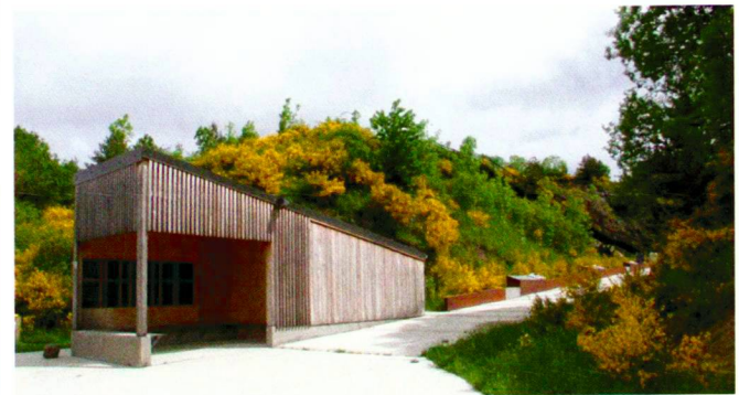
Itinéraire bis (2)

lié à la découverte du plan d'eau et des falaises d'orgue. Le passage accueille une longue table en acier corten constituant le support de quatre thématiques d'interprétation: le site réinventé, l'exploitation de la carrière, le temps du château fort, le phénomène volcanique. Le théâtre de plein air – support de festivals d'été – doit dynamiser le site. Le but a consisté à insérer les gradins et la scène de telle sorte qu'ils ne s'imposent pas au site mais en constituent le prolongement évident. Afin d'obtenir cet effet, les gradins dédiés autant au spectacle qu'à la contemplation du cratère sont insérés à l'aboutissement de la tranchée dans le talus existant. Réalisés en béton de basalte préfabriqué, ils sont contenus entre deux voiles d'acier corten qui constituent des pare-cailloux et des mains courantes accompagnant la descente. La scène s'établit sur l'eau, tel un radeau avec les falaises d'orgues en toile de fond. Elle est recouverte d'un platelage en bois de mélèze.