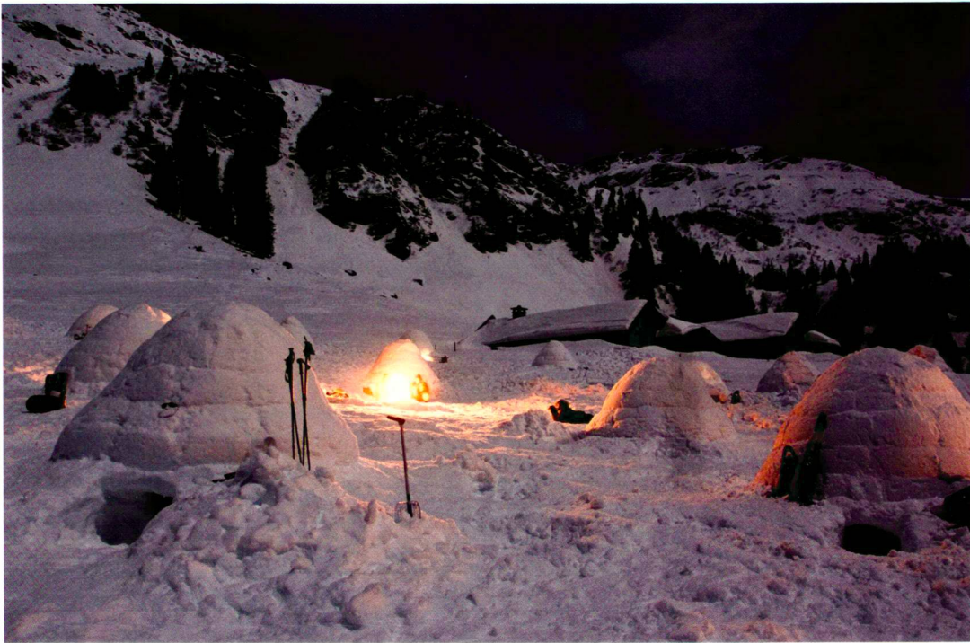
Philipp Dubs / Transa

Iglubauen beim Transa-Winterfestival 08.