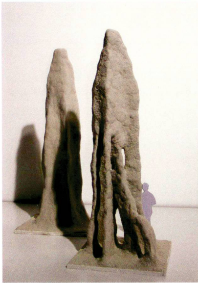
Vogt Landschaftsarchitekten (2)