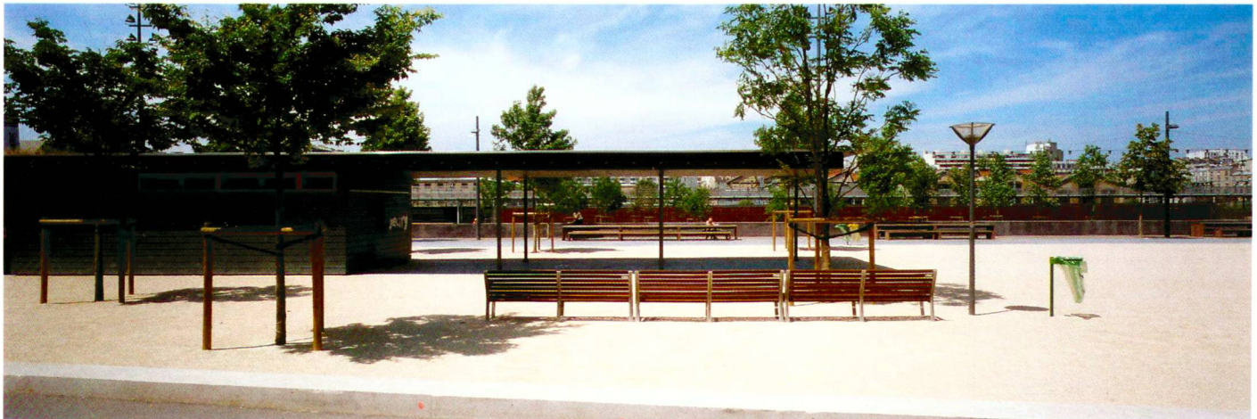
O. Wogenscky (2)