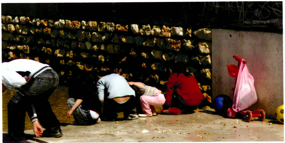
Mauer aus Meulière-Steinen und Wasserbecken.