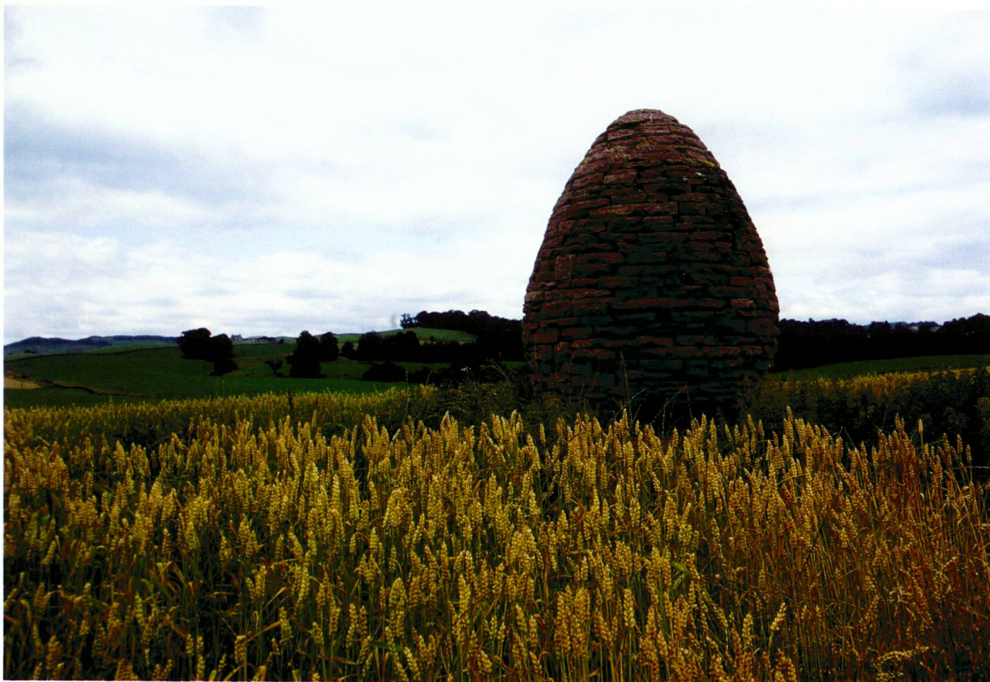
Skulptur von Andy Goldsworthy, Penpont, Dumfriesshire/Schottland.